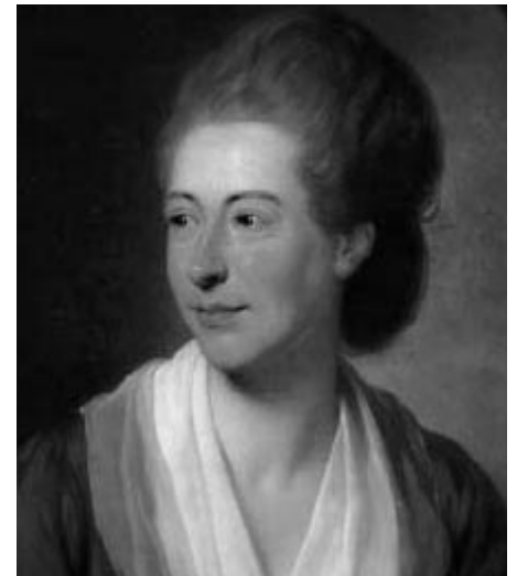
Belle van Zuylen

lende standpunten. Zo verwerpt ze Lockes idee van een tabula rasa resoluut. Volgens haar kan de mens onmogelijk alle ideeën uit de zintuiglijke ervaring afleiden. Het idee van 'oneindigheid' kan bijvoorbeeld onmogelijk op zintuiglijke waarneming worden gebaseerd en dus moet de mens wel aangeboren ideeën hebben. Net als De Neufville trekt ze fel van leer tegen de materialisten. Vooral La Mettrie, auteur van L'Homme Machine (1747), moet het ontgelden: 't gevoelen, dat de mensch