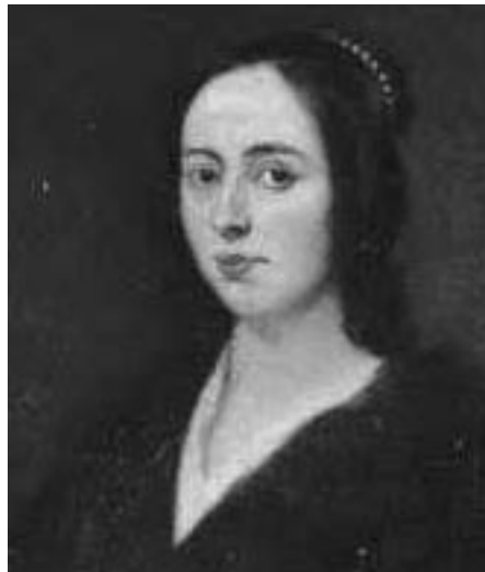
Anna Maria van Schurman